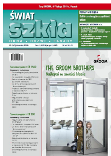
Świat Szkła 12/2019